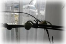
★ 胡蝶蘭の蕾 ★