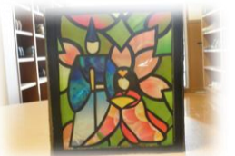
★デイサービスの作品★

2月のデイサービスの作品をご紹介します。皆様、左の写真をご覧ください！とても綺麗なステンドグラス風の作品ですね。ガラス風なのでもちろんガラスではありません(^_^)ガラスの代わりに使用している材料は、ペットボトルのラベルです！なので、近くで見ると何やら文字が書いてあったり、イラストが書いてあるのがわかりますが・・・ある程度離れて眺めてみるとすごく綺麗なのです。この作品作りはデイサービスの皆様にとても好評で、いつも以上に熱心に楽しんで取り組んでいらっしゃいました。職員はラベル集めにも必死になりました。集め出すと、なんでも材料に見えてくるようで、自宅にあるプラスチック容器のほとんどが裸になった職員もいます。お菓子の袋も大活躍しました！ペットボトルのラベルでこんなに綺麗な作品ができるとは！？誰もが驚いて大好評な作品でした(^_^)