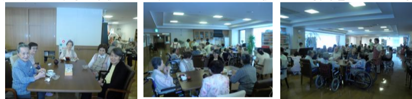
★賑やかな喫茶の様子★