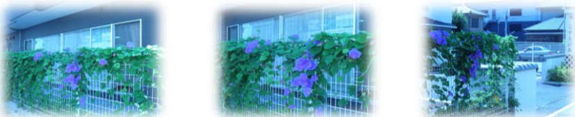
★ 健気で可愛い朝鮮朝顔 ★

こすもぴあ敷地内に入る入口横のフェンスに朝鮮朝顔が満開に咲いている(8月初旬現在)のご存じでいらっしゃいますか？ 3年前のこすもぴあ開設当時の夏にデイサービスの看護師が自宅から一株だけ持ってきて植えたものが、3年目を迎えた今年の夏、毎朝、元気に見事な花を咲かせてくれて、楽しませてくれています。植えた当時は元気がなく、蔦をからませたフェンスから何度も落ちたり、雑草に間違われ、抜かれてしまったこともあります…(>_<)何かトラブルがある度にデイサービスの職員が手助けし可愛がってお世話をしてきました。 その甲斐あって、この夏とうとう見事な咲きっぷりで、生命力の強さに驚き、感動しています。蔦をしっかりとフェンスにからませて鮮やかな紫色の大きな花をたくさん咲かせてくれていて、出勤してくるとまず鮮やかな紫が目飛び込んできて、目が覚めるような気分になります。朝に咲いているので、見て頂ける機会は少ないですがもし、見かけたら、「頑張ったんだね～」と褒めてあげて下さいね(^_^)