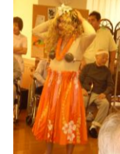
★着せ替え競争のフラガール★