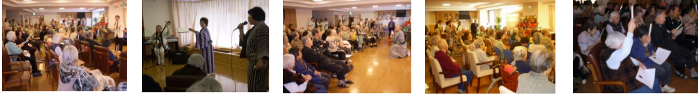
★ 雑 祭 り 会 の 様 子 ★

3月3日は桃の節句ですね。こすもぴあでも雑祭り会をケアハウス・デイサービス・小規模多機能ホーム合同で開催しました(^) メインイベントは、ボランティアで来て下さった「富士演芸同志会」の皆さんの歌や、踊りの歌謡ショーの観賞です。懐かしい昭和の大衆演芸のような感じで浪曲もあり皆様、ほのぼのとして鑑賞されていました！最後は「見上げてごらん夜の星を」をお部屋を暗くしてペンライトを揺らしての大合唱です。まるでコンサート会場に来ているようで楽しかったです！その他にも、デイサービス職員特製の雑祭り用の記念撮影用パネルで撮影会も行いました！お昼御飯は、もちろん行事食でちらし寿司を召し上がっていただきました。(詳しくは別紙をご参照下さいませ) 歌の通り、♪今日は～楽しい～雑祭り～♪となりました(^)