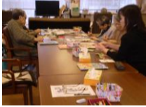
出来上がった絵手紙→