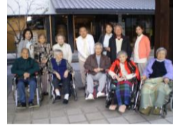
★晴れの日にはお散歩に行くことも！日帰りツアーもあります★