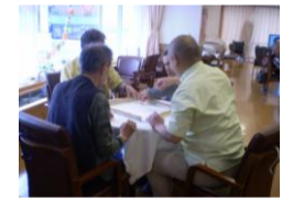
★男性は麻雀がお好きです★