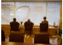
★足湯&絵手紙作成の最中★