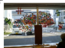
わかりにくいですが、もみじです・・・

今月もこすもぴあ内で、素敵な作品を見つけました！！まずは、バラのリース。折り紙で作っています。一つのバラを作るのに数枚の折り紙を組み合わせてます。写真では伝わりにくいですが、本当にきれいに仕上がっています。3Fのご利用者様と職員の作品です。とてもきれいなので手間がかかる作品なのは承知の上で、1F用にも作って欲しいと厚かましくお願いして作ってもらいました(^)もう一つはデイサービスの作品です。毎回、その時期にあったテーマで足湯前の大きな窓に大作を作ってくれます。今回は、もみじの木です。赤く色づいた葉っぱと、大きなトンボが飛んでいて秋モード全快です！この他にも、各フロアごとに秋らしい作品がたくさんです。こすもぴあにお越しの際はぜひ、ご覧下さいね。