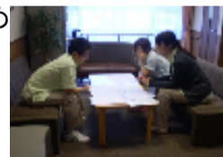
←打ち合わせ中の職員

10月20日に「運動会」を開催します。こすもぴあ初の運動会です！みなさんに楽しんでいただけるように、担当職員はじめご入居者様にもお手伝いいただき楽しい運動会になるように準備をすすめています。運動会の様子は来月号にてご報告させていただきます。