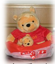
★ 癒し系です ★

先日、ある方から「クマのプーさん」のぬいぐるみをこすもぴあに頂きました。大きいプーさん&小さいプーさんのセットで、あの愛くるしい顔でじつとこちらを見つめてきます(笑)どこに飾ろうかといろいろ考えて、たくさんの方が通る正面玄関ホールに飾っています。玄関ホールにはその季節のお花や、お人形などをいつも飾っていますが、たまにはキャラクターを飾ってみようということで、玄関にプーさんが登場しました。ご高齢の皆様にはプーさんはあまり馴染みがないかもしれませんが、どんな反応をされるか、楽しみにしていました。すると、多くの方が「なんて、かわいい熊さんなの!」「可愛い顔!」などなど通る方が次々に立ち止まりプーさんを眺めて、撫でていかれました。「老若男女・年代問わずに受けがいいんだなあ」と何やらプーさんに感心してしまいました(^.^)