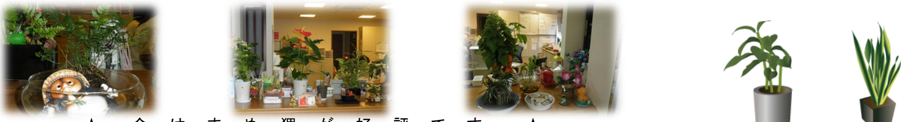
★ 今はまめ狸が好評です ★

皆様も薄々お気づきでしょうが、1F事務所のカウンターや正面玄関付近にいつの間にもたくさん緑が増えて気がつくジャングルのようになってきました。ほとんどが、頂いたものなのですが、一人の心優しい某職員が毎日、愛情を注いでお世話をしているとめきめき育てきて、背も高くなり、葉も大きくなり元気いっぱいです(^.^)表から事務所の中が少々見えにくくなっており、いろいろな種類の植物があるので、たくさんの方が足を止めてお声をかけて下さいます。「あら、綺麗な色ね」「なんていう花?」「これ、お水のやり過ぎじゃない?」などなど、いろいろなことを話しかけて下さいます。そこから、会話に花が咲き、ぱあ〜と玄関が明るくなります。よく見ると、いろいろな動物達があちこちに潜んでおり、それを見つけてまた楽しんで下さいます。皆様とお話できる機会が増えて嬉しいです♪ちょっと見えにくいかもしれませんが、事務所に何か問い合わせがある時は、掻き分けてお呼び出し下さいね(笑)