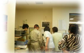
★火災報知器の確認です★