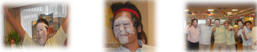
★飴食い競争で大奮闘の職員達★