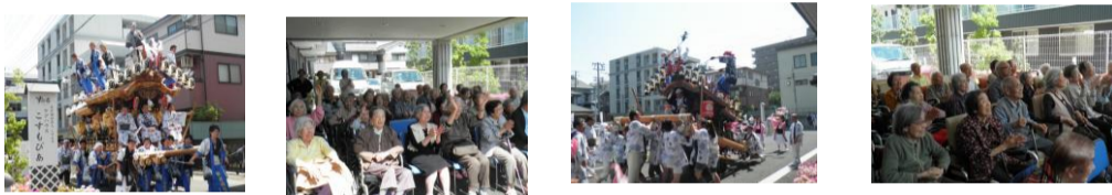
☆だんじり見学の様子☆

5月5日に毎年恒例のだんじり祭りがあり、例年どおりこすもぴあの前までだんじりが来てくれました!!! こすもぴあでだんじり見学が始まって3年になるのですが、毎年この日は快晴でだんじり見学にぴったりの気候なんです。きっと皆様の日ごろの行いが良いんですね♪ 今年も皆様に玄関前のイスに座っていただき、だんじり見学をしていただきました。皆様だんじりが来るのを今か今かと首を長くして待っておられ、太鼓や笛の賑やかな音とともにだんじりが登場すると一気に笑顔になられ拍手をして喜ばれておりました。 特に魚崎が地元の方にとっては懐かしかったようで「今年もだんじりが見れてよかった～」と感動されておりました。 1年に1回のこの機会を楽しみに、またこの1年を皆様と楽しく過ごしていきたいと思っております(^o^)