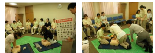
☆救急救命講習の様子☆

東灘消防署の救急救命士の指導のもと、看護師・介護職を中心に救急救命講習を行いました。 今回の講習では、緊急時に救急車が到着するまでに行う一次救命として心肺蘇生やAEDの使用方法を教えていただきました。一人ひとり人形を用いて救命処置を行ったのですが、やはり頭で考えるのと実際にやるのでは違いも大きかったようで救命処置の難しさを痛感しました。しかし、同時に一次救命の大切さも教わり、少しでも知識や技術を習得しようと皆真剣に講習に取り組みました。 救急救命を行うような事態がないことが一番ですが、万が一の時のためにも今後も勉強を重ねていきたいと思っております。