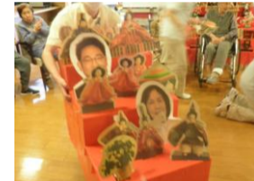
★出来上がったひな壇★