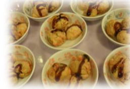
★出来上がったたこ焼き★