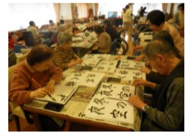
★書道クラブの様子★

2月から書道クラブがスタートしました。『冬の夜空』『梅咲く里』というお手本を見ながら筆をとっていただきました。久しぶりに筆を手にされた方も多く、緊張しながらも夢中で書かれていました。また、ボランティアで書道の先生にもお越しいただき、皆様の周りをまわってアドバイスや評価をしていただいたのですが、何枚と書き重ねていくうちに少しずつ上手く書け、先生からいただく花丸の数もどんどん増えていきました。今後も月に1回のペースで行っていく予定なのでぜひ参加してくださいね(*^_^*)