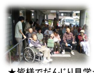
★だんじりのパフォーマンスの様子★