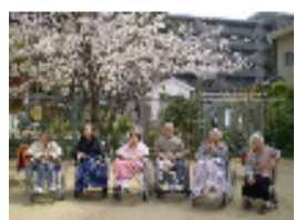
お花見散歩(魚崎八幡)