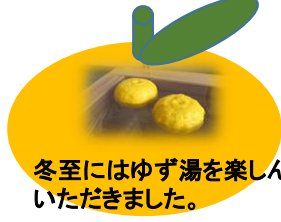
冬至にはゆず湯を楽しんでいただきました。

ボランティアグループ『ベル・グレイセス』の皆様をお招きし、ハンドベルを披露していただきました。近隣から聴きにきていただくほどの盛況ぶりでした。ハンドベルのクリスマスらしい神聖な響きをたっぷりと堪能していただきました。