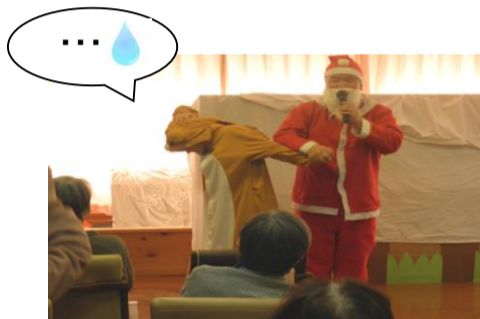
* サンタ & トナカイ *