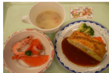
★クリスマスの御食事★ クリビヤック 丸鳥のショーフロワー オードブル(天使のエビとサーモン) クラムチャウダー