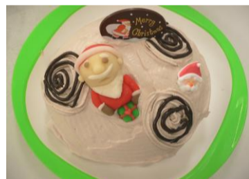
★クリスマスケーキ(チョコレート)★