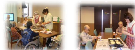
★お好みレクレーションの様子★

5月17日(火)に3階でお好み焼きレクレーションをこないました。 ホットプレートに生地を流して、豚肉を乗せて、ひっくり返して、美味しくできるかな？とじっ〜と生地に熱い視線を送りながら待つこと10分ぐらいい…。まん丸で、ふっくらしたお好み焼きが出来上がりました！！フロア全体にソースのいい香りが充満すると自然と皆様のお顔が笑顔になりました。お好み焼きを食べて頂くと、更に笑顔の輪が広がり、会話も弾んでいらっしゃいました。お好み焼きは、関西の家庭では夕食のメニューに上ると盛り上がりやすいですね。特に子供は大好きなのでよく食べます。次々とかかるおかわりの声に、家族のお母さんはみんな自分が食べる暇がないくらい焼き続けなければいけませんね。お好み焼きを通して、皆様が御家族で囲まれた、暖かい食卓のひとときを思い出していただくことができましたら嬉しいです(^^)