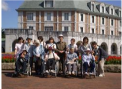
★フルーツフラワーパーク★