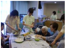
★クッキー手作り中★