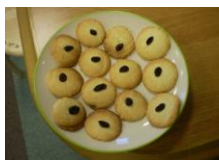
★出来上がったクッキー★