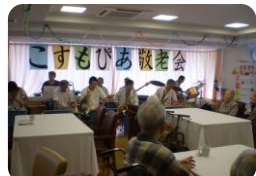
★バンド演奏の様子★