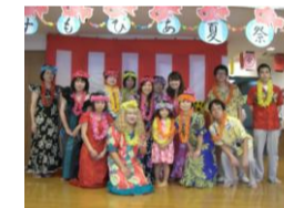
こすもぴあハワイアンズ