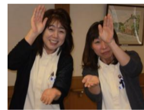
★ カントリーダンス観賞会の様子 ★